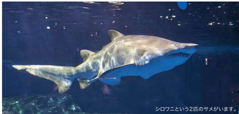
シロワニという2匹のサメがいます。