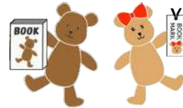
ブックマくん しおりちゃん