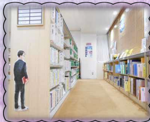
大崎図書館分館 ティーンズ書架

ティーンズコーナーでは図書館に新しく入った中高生向けの「本の帯」を展示しています！読書欲をそそる帯を厳選して展示しています。ぜひ見てくださーいね。 いつも選ぶのとはちょっぴり違う本に出会えるかも…？