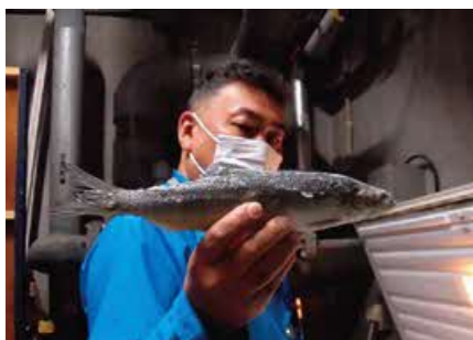
サメの餌(ニシン)。週に1回、サメ1匹につき7匹程度食べます。