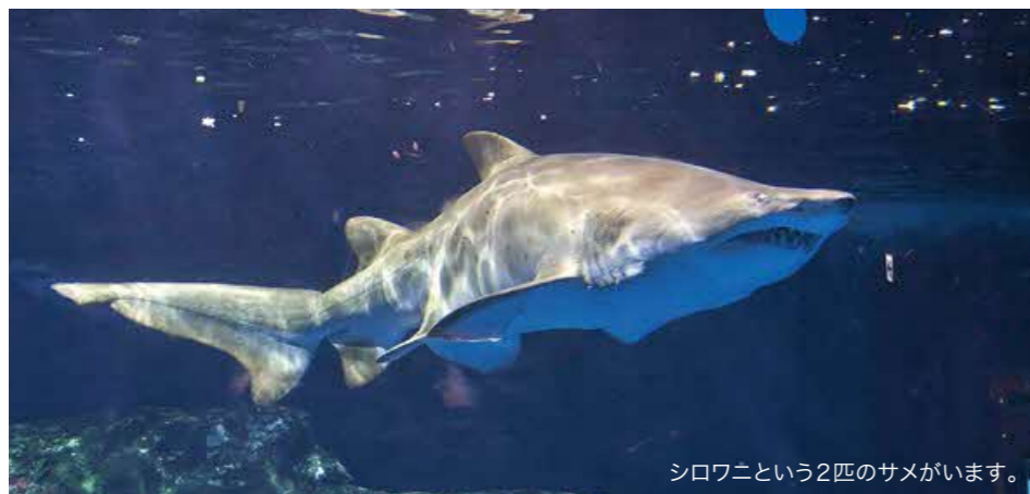
シロワニという2匹のサメがいます。