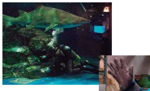
サメ水槽では、シャークスーツ(鎖を編み込んだ特殊なスーツ約8kg)を着て清掃します。