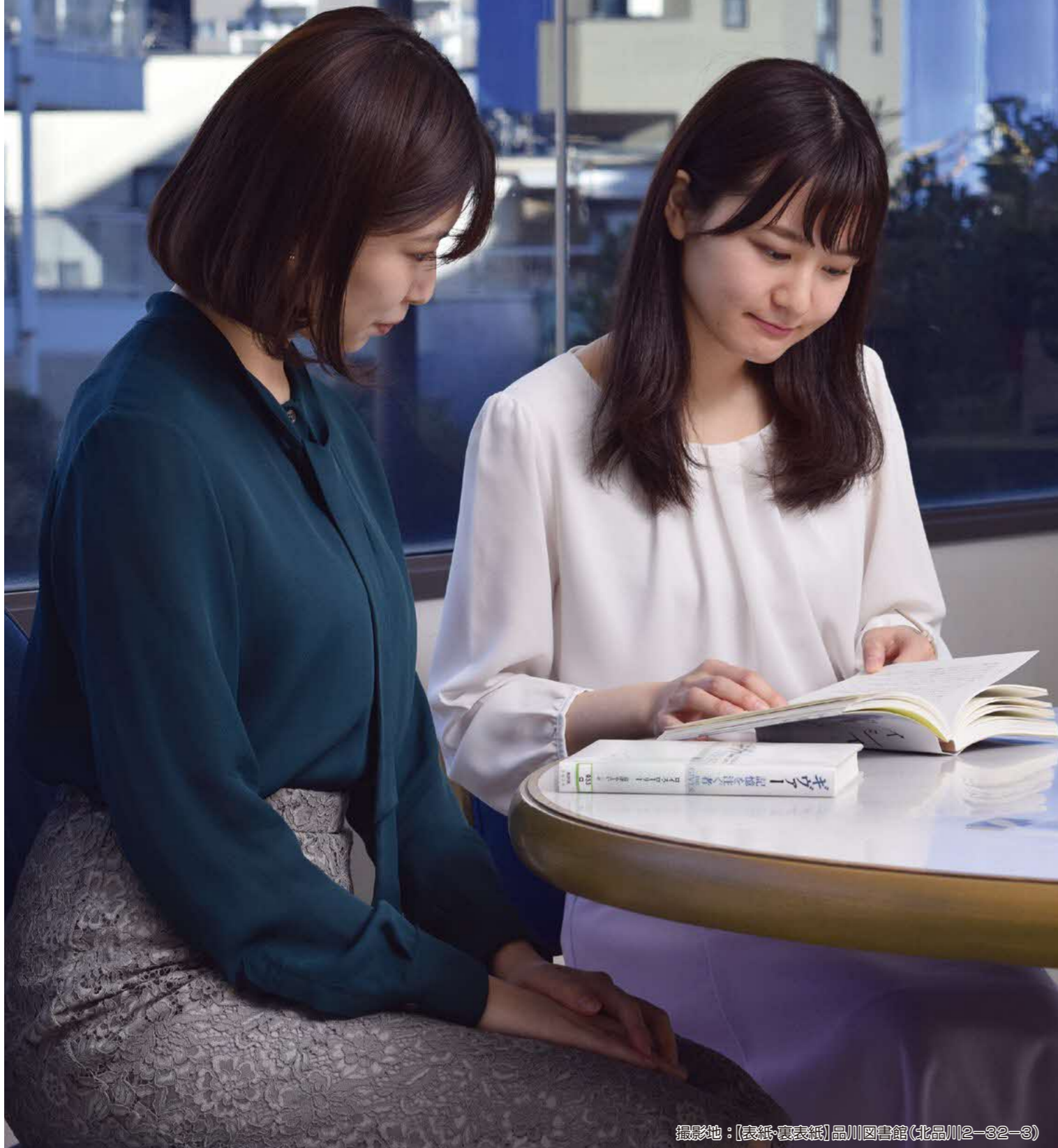
撮影地: [表紙・裏表紙] 品川図書館(北品川2-32-3)